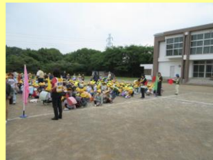
引き渡し訓練の様子